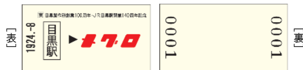
【メグロ生誕の地ウォークラリー達成記念レプリカきっぷ】