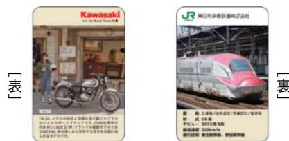
【限定カード(バイク:W230×新幹線:E6系)】