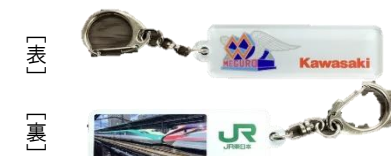
【JR東日本×カワサキモータース 限定コラボキーホルダー】

①②を達成し、「山あげ会館」 ※1 でスタンプ台紙をご提示いただくと、「JR東日本×カワサキモータース限定コラボキーホルダー」(先着500個)をプレゼントします。