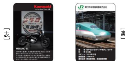
【限定カード(バイク:MEGURO S1×新幹線:E5系)】

宝積寺駅、烏山駅両駅の「駅スタンプ」を集めて、「山あげ会館」 ※1 でスタンプ台紙をご提示いただくと、「限定カード(バイク:MEGURO S1×新幹線:E5系)」(先着1,000枚)をプレゼントします。